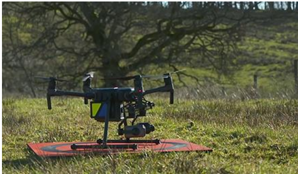
Dròn DJI M210

bhon Chèitean 2019. 'S e DJI M210 am prìomh dhròn obrachail aig Poileas Alba – cuad-coptair le buanas 20 mionaid a thìde – a tha air a chleachdadh le grunn fheachdan poileis agus luchd-cleachdaidh coimearsalta air feadh Bhreatainn agus an t-saoghail gu lèir.