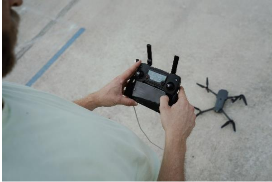
Fear a' stiùireadh dròn coimearsalta

Thathar a' fàisneachd gum faodar drònaichean a ghnàthachadh mar mhodh-lìbhrigidh airson bathair luchd-ceannaich sna beagan bhliadhnaichean ri thighinn 3 , agus a bhith nam pàirt àbhaisteach de thaisbeanadh-solais aig consairtean no dealbh-chluichean mòra.